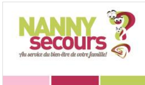
Carte d'affaire du Réseau Nanny secours

En adhérant au Réseau Nanny secours, vous pouvez bénéficier d'un lot de cartes d'affaire à votre nom ainsi que de nos cartons publicitaires. Vous n'avez qu'à en faire la demande. Ceci vous permet d'avoir des outils promotionnels professionnels en attendant d'être prêt à créer les vôtres!