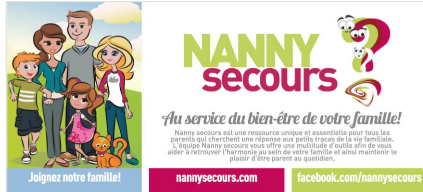
Carton publicitaire Nanny secours